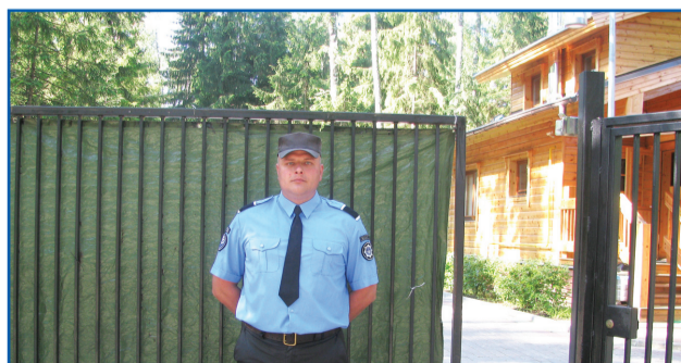
Коттеджный поселок «Фортуна»